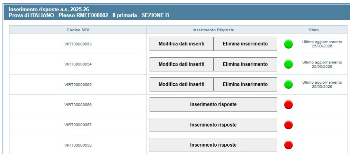
Figura 2: elenco degli studenti nel modulo web "Inserimento risposte" - prova di ITALIANO

Cliccando sul pulsante di ciascuna prova (nell'esempio in Figura 2 "ITALIANO") si accede all'elenco di studenti della classe.